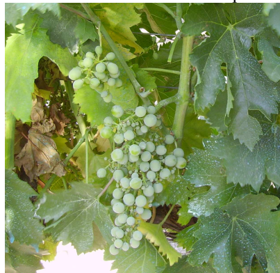
FOT.2. Racimos claros